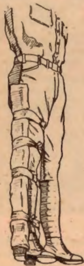
Manera correcta de tratar una pierna contusa.

Para hacer frente a la anticipada necesidad de facilitar el trabajo de las enfermeras durante el período de la emergencia nacional la Oficina de Defensa Nacional de los Estados Unidos de América ha solicitado de la Cruz Roja Americana el entrenamiento de 100.000 Asistentes Voluntarios de Enfermeras.