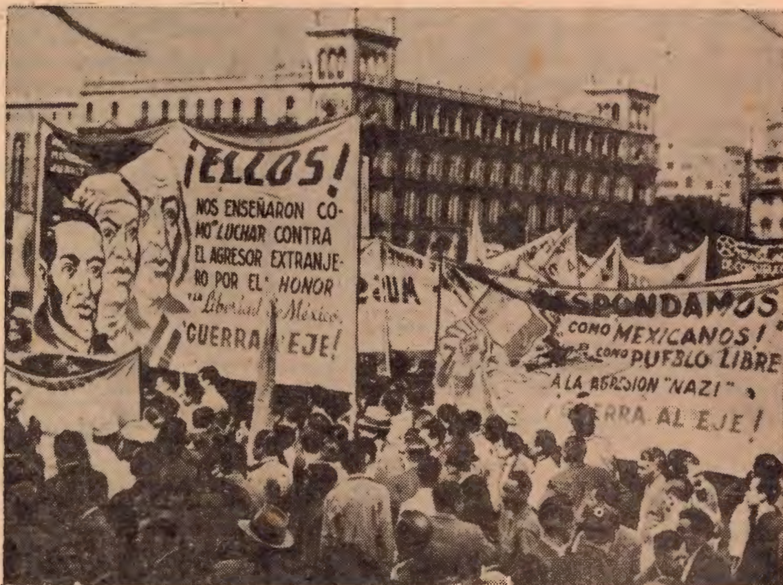
Millares de ciudadanos mexicanos manifiestan, en la plaza de la Constitución de Ciudad de México, su indignación contra las potencias del Eje y piden que se les declare la guerra.