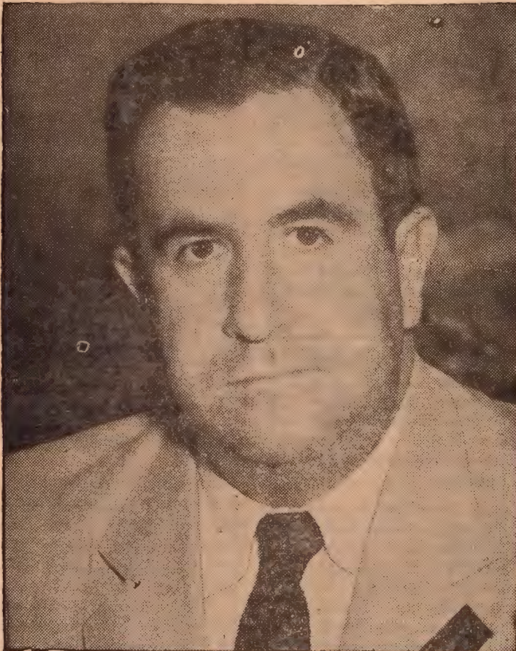
Gral. Manuel Avila Camacho, Presidente de México.

La más importante, por su intensidad y su posición