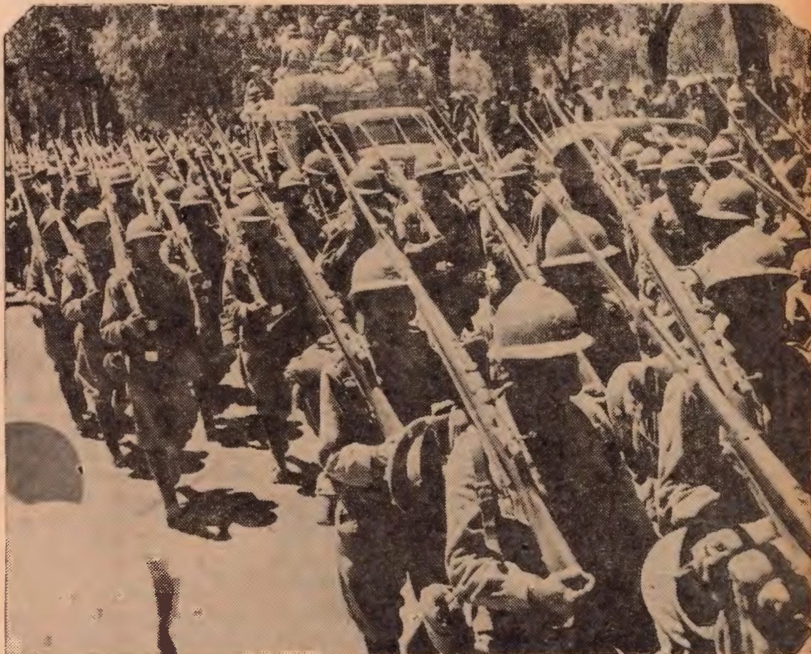
Desfile de tropas mexicanas por las calles de Ciudad de México, después de terminadas las maniobras. México, cuya fuerza militar ha visto aumentada su potencia, se ha unido a las naciones que están en guerra contra el Eje.

La designación de Lázaro Cárdenas como comandante de la zona del Pacífico significa la seguridad nacional de México.