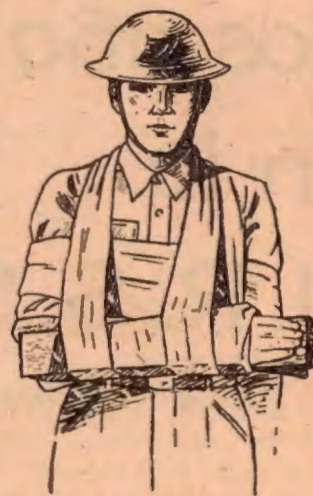
Modo correcto de "entablillar", un brazo

Parecido a lo anterior y ordenar el registro de los pacientes; desvestir y vestir niños; pe-